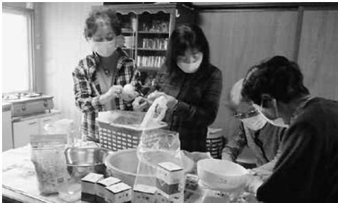
計りを使って計測