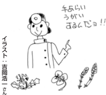
イラスト：吉岡浩一さん