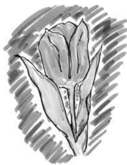
イラスト：横原和雄さん