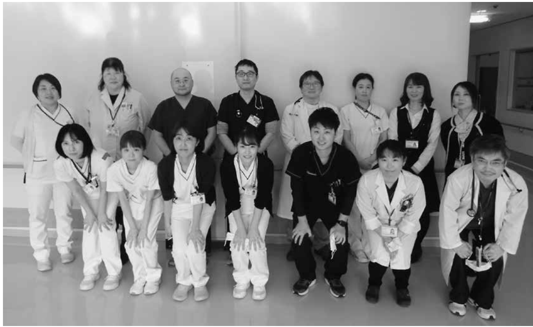
心不全チーム メンバー