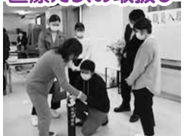
落ち着いて、落ち着いて