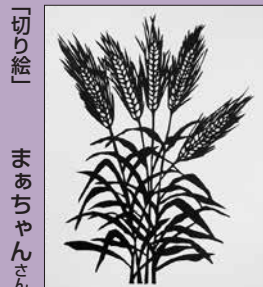
「切り絵」 まあちゃんさん