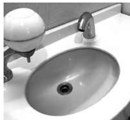
自動水栓になり、安心・安全・便利になりました。

してきました。これまで、視野を広げながら楽しく学ぼうと、外部講師を招いたり、グループワークを中心に実施するなどの工夫をしてきました。昨年は、その長い歴史の活動を中断せざるを得ない状況が続きました。 新年度を迎え、今年こそは活力ある日常を取り戻そうと「いきいきタイム」を再開しました。テーマは、2021年度方針です。この活動が、継続できるようにさらに工夫を行っていきます。 (虹 岩井計子)